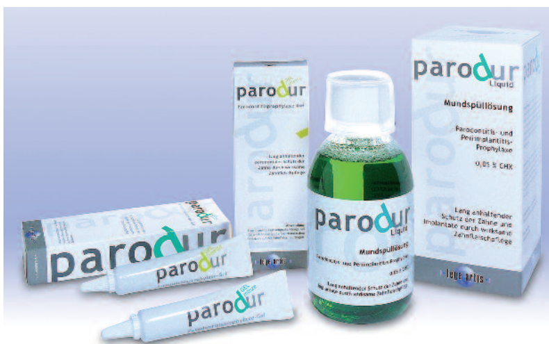
Abb. 2: Die parodur-Produktfamilie.

Wenn im schlimmsten Fall beide Partner von einer Parodontitis betroffen sind, aber nur einer davon die Prophylaxe- oder Parodontalbehandlung durchführen lässt, kann dies zu erhöhter Rezidivgefahr des behandelten Patienten führen. Bei jeder Kontrollsituation wurde die Blutungsneigung (Gingivitis) mit den DiagnoSTIX überprüft und die Behandlungsintervalle neu festgelegt. Bei jeder Veränderung – egal ob positiv oder negativ – wurden Behandlungsschritte und Patientenmotivation beachtet sowie Hilfsmittel und Pflegeprodukte indivi-